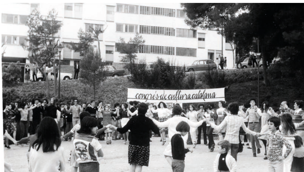
El Congrés de Cultura Catalana al barri als anys setanta