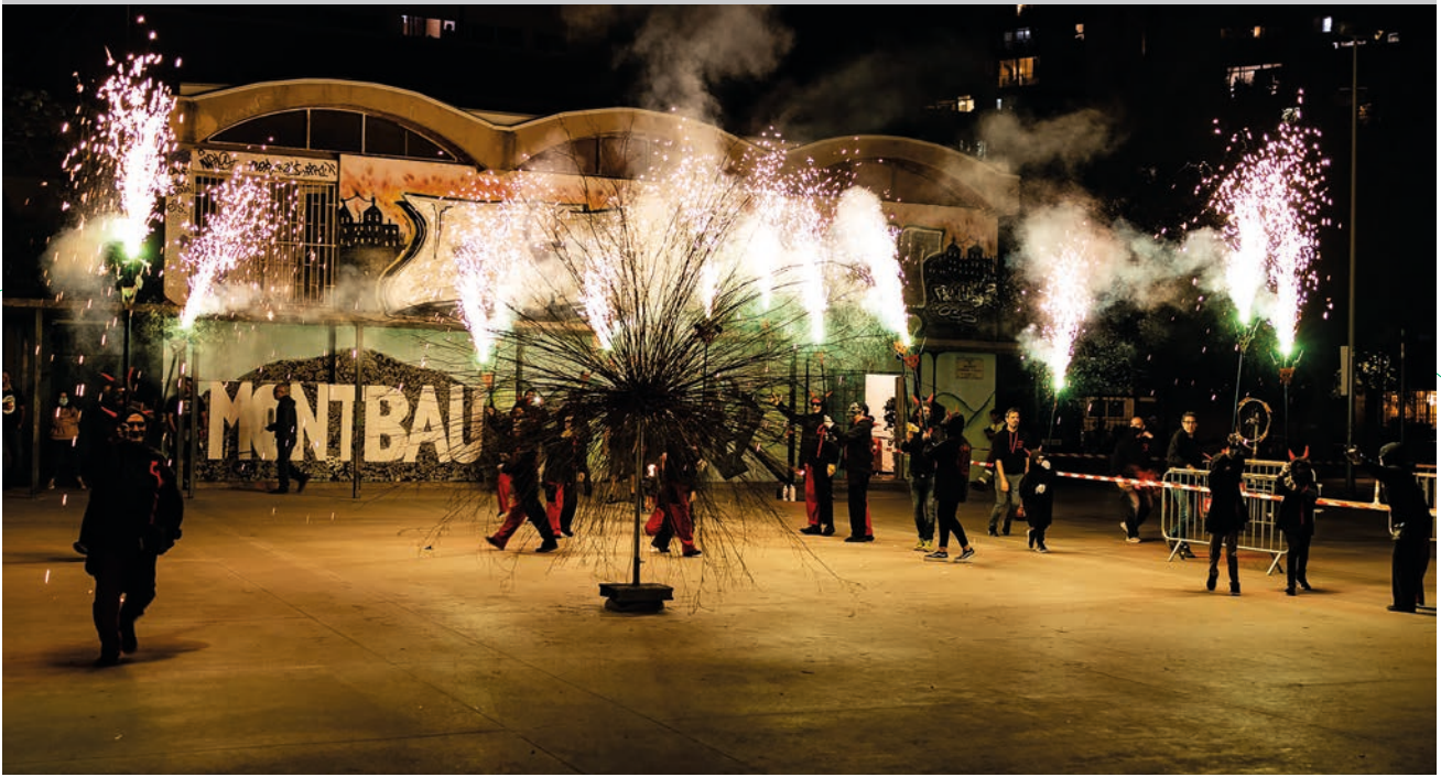
Rita Flowers a les festes majors de Montbau