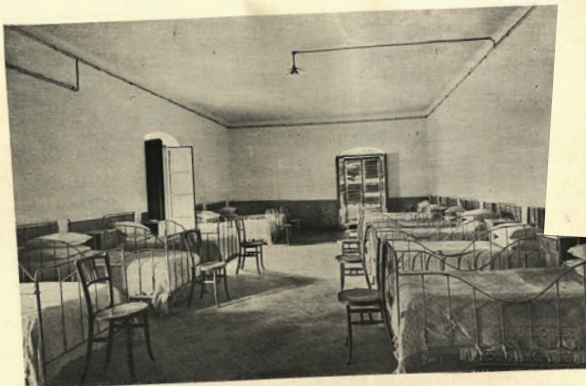
TORRE DELS FRARES: DORMITORI

Dibuixos i fotografia dels pavellons al llibre de la Casa Provincial, 1918