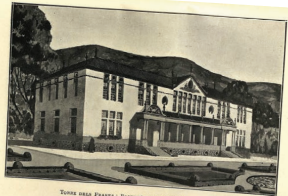
TORRE DELS FRARES: PAVELLÓ PER A EPILÈPTICS (ADULTS)