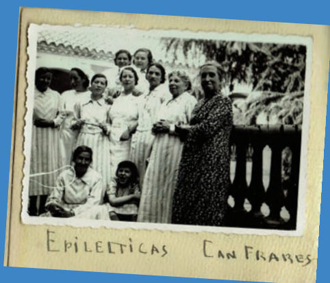
Menjador de Can Frares per Adolf Mas.

L'any 1914 la Mancomunitat de Catalunya assumí les tasques de beneficència i de cura de la salut mental. Des d'aquest moment, en la segona dècada del segle XX, la Mancomunitat es va plantejar millorar les instal·lacions que hi estaven dedicades i va adquirir dues masies del voltant d'Horta, Can Tarrida i la Casa dels Frares. Avui totes dues han desaparegut.