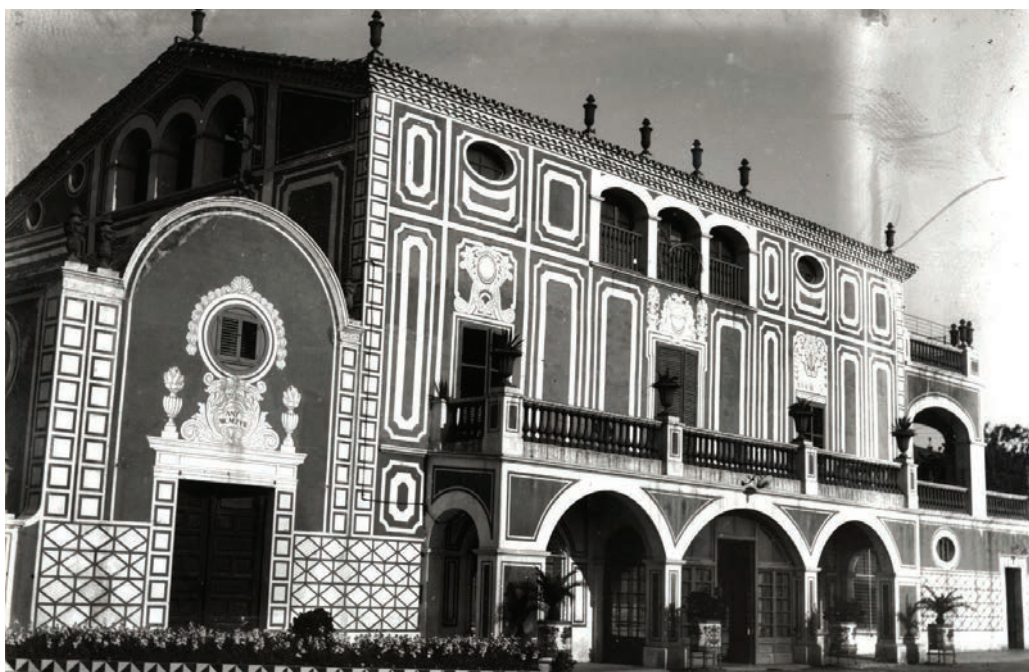
Can Frares, asil de dones epilèptiques. Adolf Mas.