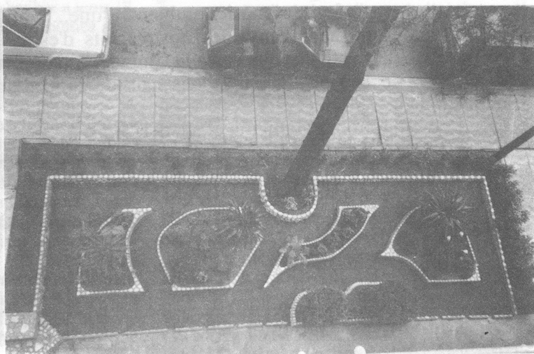
Els parterres del carrer Vayreda que han ajardinat els propis veïns

de forma espontànea i vol estendre's. Una forma com una altra de viure al barri i viure el propi oci individual (p.10).